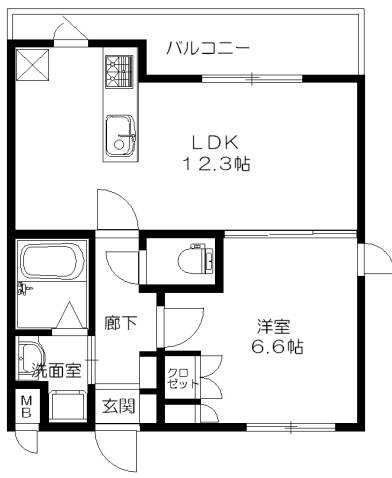
Aタイプ 反転有 専有面積 42.52㎡