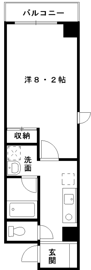
B t y p e (専有床面積/26.45㎡)