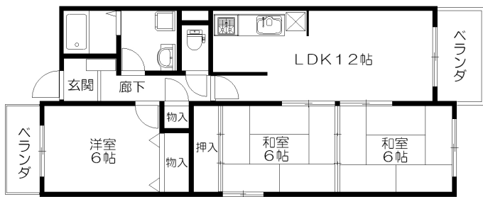
Cタイプ ※1Fのみ専用庭有