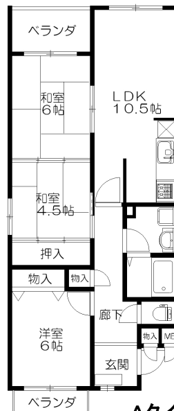
Aタイプ ※1Fのみ専用庭有